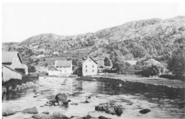
Aabergs mølle ved Lundeåne.