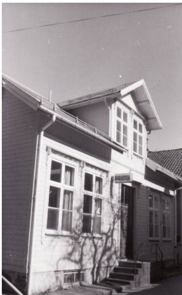
Biblioteket holdt til i Peder Clausens gate 28 fra 1959 til 1986.

I 1899 ble det igjen søkt om statstilskudd, denne gang på kr 200. Søknaden ble innvilget, og siden ble statens tilskudd årvisse.