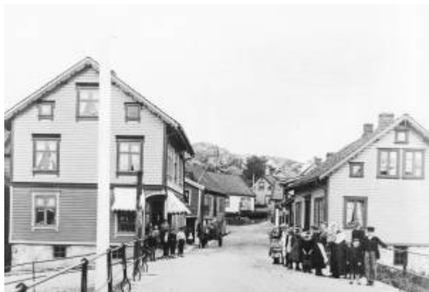
Damsgård bru, cirka 1895/96.

Bru over Lundeåne , mellom Elvegaten og Gamleveien .