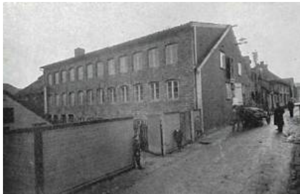
Eger Mølle 1917.

Eger Mølle ble bygget for G. Albrethsen & Sønner, Geirulv Albrethsen (1869 - 1952). Albrethsen drev kolonialhandel og hadde også butikk for salg av kraftfôr, frø, såkorn og landbruksmaskiner.