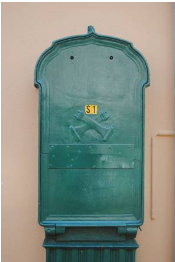
Koblingsskap for Egersunds Telefonselskab.

Byens første telefonlinje ble satt opp mellom jernbanestasjonen og Dampskipskaien i slutten av mai 1887 av tre unge teknologiforkjempere. De to viktigste kommunikasjonspunkter i byen hadde dermed fått et godt hjelpemiddel for å samordne korrespondansen mellom båt og tog.