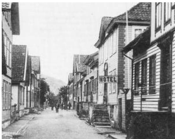
Ellingsens Hotel, 1897.