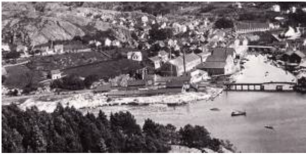
Gruset under utfylling, ca 1920.

Området mellom Jernbaneveien og Vågen som i dag (2011) brukes som drosjeholdeplass, rutebilstasjon og parkeringsplass.