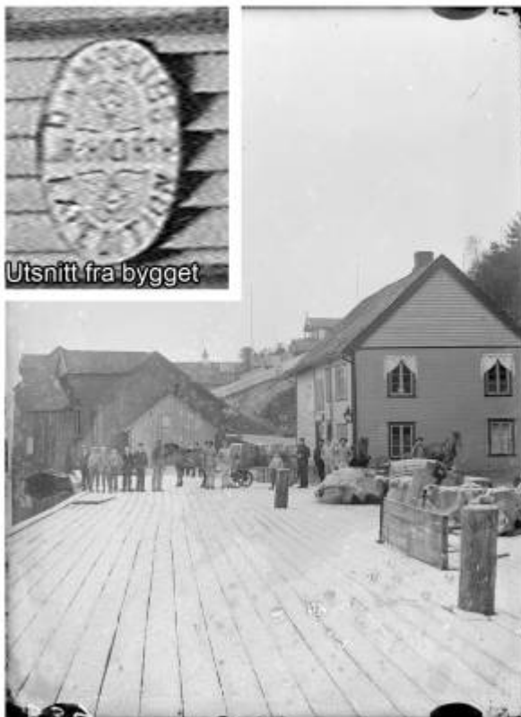
J. Hiorth Dampskibs Expedition rundt 1900. I øvre venstre hjørne er et utsnitt fra vegg på ekspedisjonens forside, som viser et skilt med logoen til dampskipsekspedisjonen.