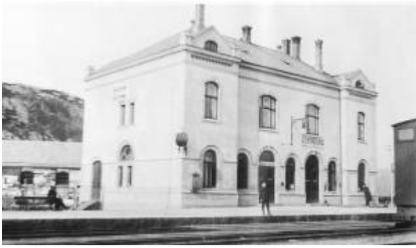
Stasjonsbygningen i 1912.

Den sørlige endestasjonen på Jærbanen ble lagt på Arenes ved Egersund sentrum. Eiendommen ble innkjøpt for 7 000 spesidaler.