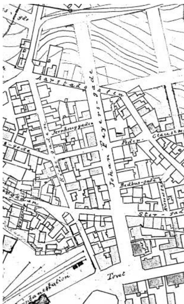
Utsnitt av Reguleringsplan 1905