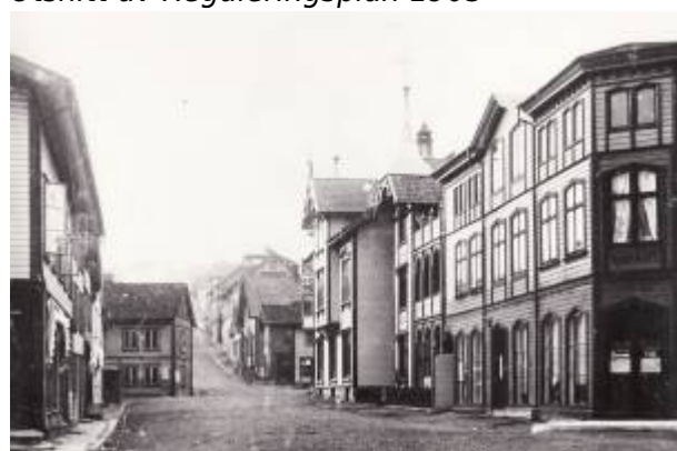
Johan Feyers gate, 1897.

Gata ble regulert som Branngate i Reguleringsplan 1858 , og gikk da helt til bygrensa. På plankartet er den benevnt Alminding II . På bildet fra 1890-åra er den fortsatt ikke helt gjennomført som branngate, men i 1905 var den opparbeidet etter reguleringsplanen og hadde bebyggelse på begge sider på strekningen mellom Torget og Årstadgaten. I Reguleringsplan 1905 ble den regulert fram til Gamle Prestegårdsvei .