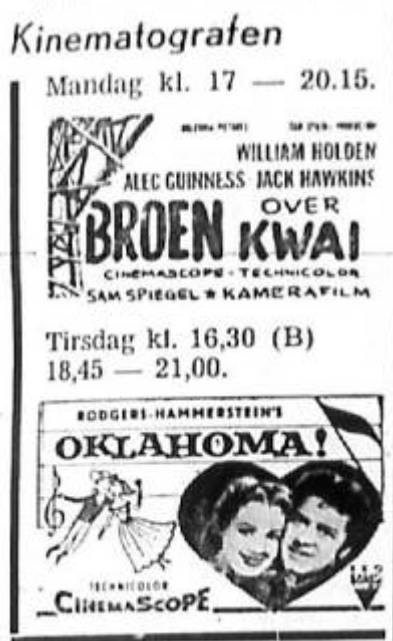
Annonse i Dalane Tidende 23.02.1959

Men folk ønsket kino. I 1921 var det slutt på Arbeiderpartiets tålmodighet, og partiet lot prinsippene falle. På slutten av året stiftet flere partimedlemmer Egersunds Selskabelige Forening, hvis formål var å vise film i Folkets hus - Festiviteten i Sandakergaten 6. Offentlige konsesjonsvilkår ble unngått ved at man måtte være betalende medlem i foreningen for å kunne delta på «møtene», dvs. filmframvisningene. Det første «møte» ble holdt 17. februar 1922, og den svenske filmen «Körkarlen» sto på programmet. Den lukkede foreningen ble en stor suksess fra første dag, og allerede etter få dager hadde den fått over 500 medlemmer. Men medlemskapet var ikke mer eksklusivt enn at det kunne tegnes av hvem som helst sammen med kjøp av billetten.