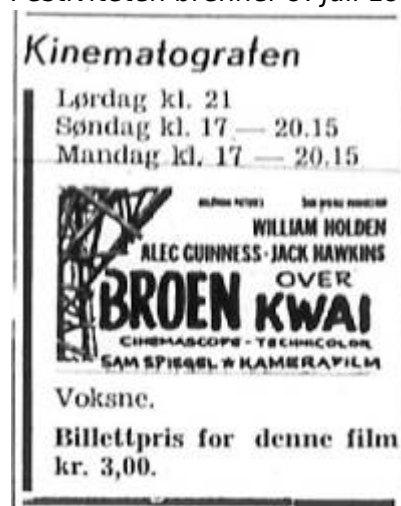
Annonse i Dalane Tidende 20.02.1959