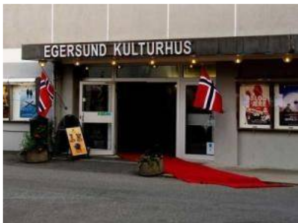
Egersund kulturhus.

Byen hadde med dette fått en ny storstue med sitteplass til 380 personer i myke stoler på skrånende golv. Bygget hadde dessuten klimaanlegg. Det tekniske utstyret var av det beste som kunne skaffes, og kinolerretet var hele 9 meter bredt slik at filmer i det nye formatet «Cinemascope» kunne vises. Det var mange som mente at byen hadde fått landets vakreste kino!