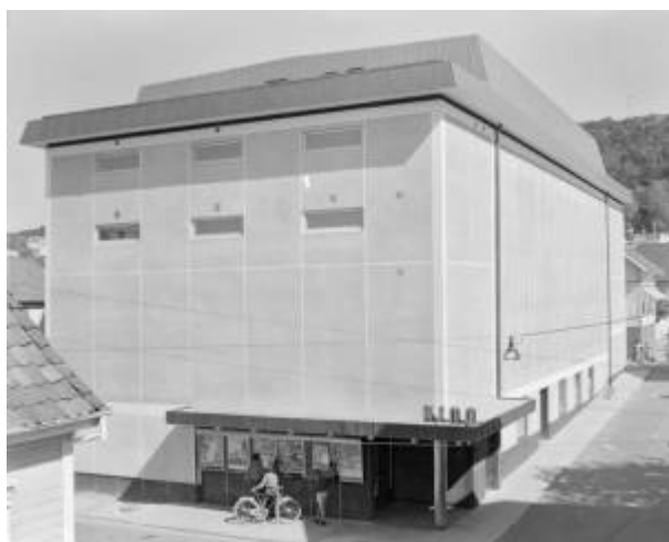
Egersund kino ca. 1959. Foto: Fotohuset/Dalane Folkemuseum.

I store deler av byggeperioden fungerte Godtemplarlokalet som kino.