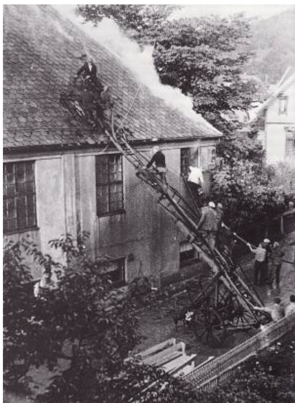
Festiviteten brenner 9. juli 1941.

Det viste seg imidlertid vanskelig å få til en kino i kommunal regi. Selv om Arbeiderpartiet lokket med gunstige leietilbud i byens nyeste og flotteste forsamlingslokale holdt de fleste politikerne igjen. De ville ikke bruke skattebetalernes penger på kinounderholdning. Andre igjen mente at kinoen brøt «med folks sedelige og moralske prinsipper».