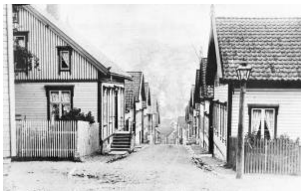
Kirkegaten, øvre del, i 1890-åra.

Gate mellom Torget og Aarstadgaten , navnsatt i 1905.