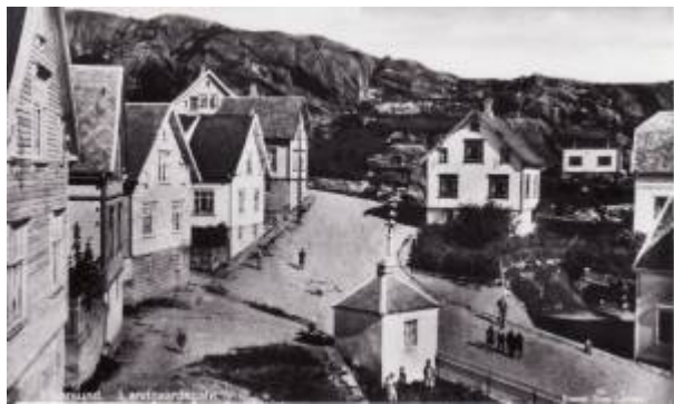
Parti fra Langaards gate.

Gate mellom Nyeveien og Gamleveien , navnsatt i 1905.