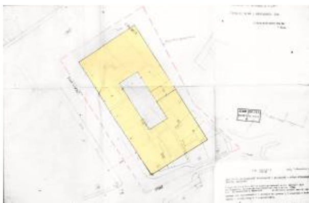
Reguleringsplan 1962.

Han tok utgangspunkt i Reguleringsplan 1931 når det gjaldt gatene rundt kvartalet, mens bebyggelsen han foreslo var av en type som var regulert i flere andre kvartalsplaner i sentrum. Kvartalene var tenkt utbygd med 3-etasjes betongbygg med flatt tak. Høydebegrensningen på 3 etasjer var satt av hensyn til byens øvrige bebyggelse som sjelden var høyere enn det – det var den tids tanker om tilpasningsarkitektur. I midten av kvartalet var det gårdsplass. Dette var ikke helt lett å få til da kvartalet var smalt og gatene ikke var parallelle.