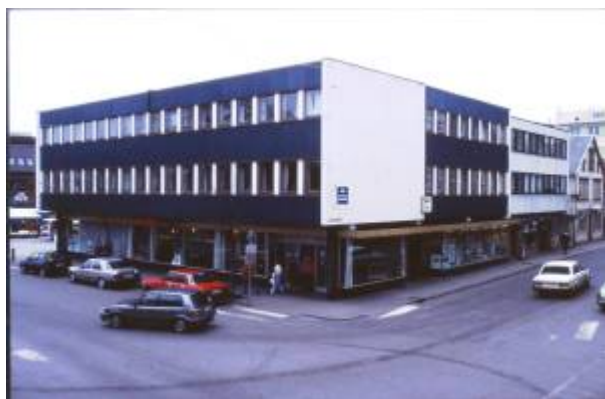
Torggården i 1991.

Plutselig dukket det opp et nytt forslag, utarbeidet på vegne av noen av grunneierne av arkitekt S. Brandsberg-Dahl i Stavanger. Dette forslaget la opp til at bebyggelsen mot Torget skulle gjøres bredere enn de gamle eiendomsgrensene og gateløpene tilsa, og innebar makeskifte mellom kommunen og grunneiere av gateareal til Kirkegaten . Forslaget innebar at kvartalet kunne bli utbygd helt rektangulært, 50×25 meter, uten forstyrrende skjeve vinkler eller usymmetriske linjer.