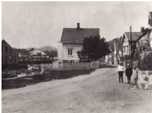
Nyeveien ca 1930, da all trafikk nordfra til og fra byen gikk her.

I 1912 ble det vedtatt en ny veglov som skulle gjelde for landdistriktene, der vegnettet ble inndelt i hovedveger og bygdeveger. I byene var det fortsatt bykommunene som hadde ansvar for alle vegene, enten de hadde gjennomgangstrafikk eller ikke.