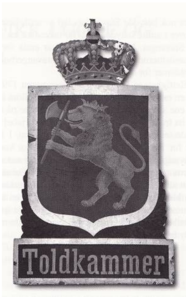
Egersund toldkammers skilt.